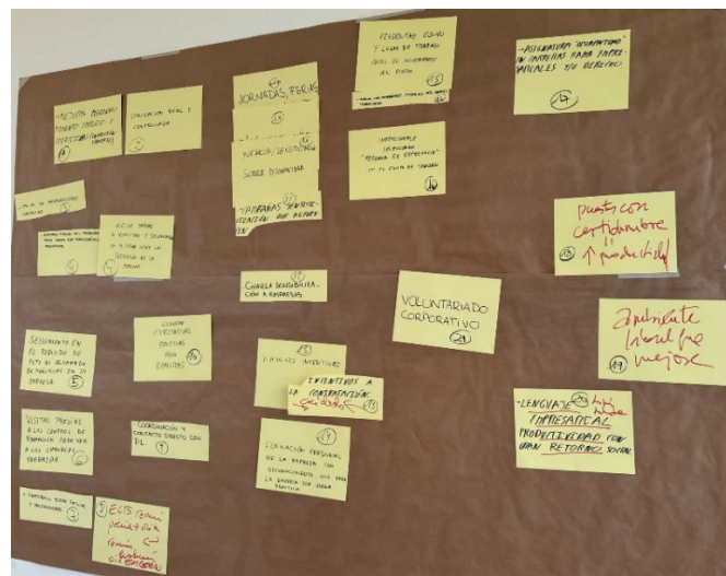
Imagen 1. Panel de trabajo del Grupo Nominal.

Durante la discusión, pueden surgir nuevas ideas que se añaden al panel. Finalmente, en la fase de priorización, los participantes evalúan las ideas propuestas. En sesiones presenciales, se utiliza un sistema interactivo, mientras que en sesiones online se emplea una plataforma web. En ambos casos, los participantes puntúan cada idea en una escala del 1 al 5, donde 5 indica la mayor relevancia.